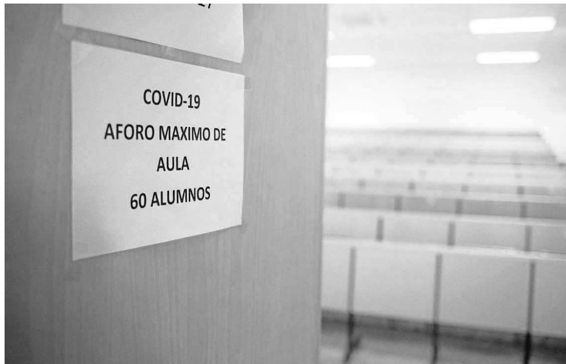
Puerta de un aula de la Facultad de Farmacia.