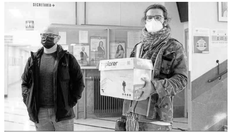
Los exámenes se guardan para pasar una cuarentena.

La misma fuente puntualizó que el pasado martes, primer día del periodo de exámenes, "nos costa que dos exámenes vieron retrasada su hora de inicio y que fi-